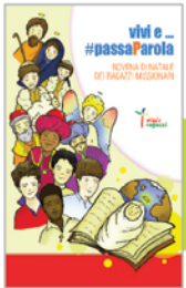
• Novena di Natale