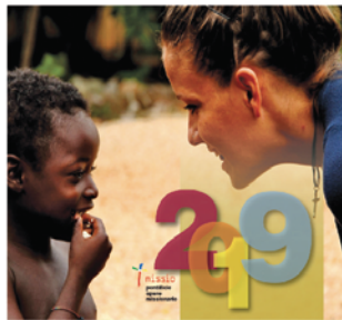
• Calendario da tavolo 2019