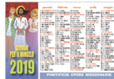
• Calendarietto tascabile