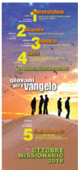
• Locandina Settimane Ottobre Missionario (cm 33x70)