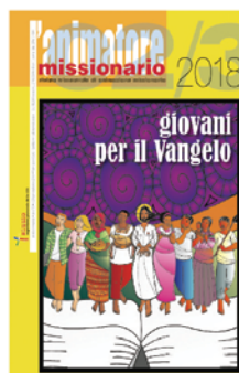
• L'Animatore Missionario n° 2/3

include il Sussidio annuale per Adulti, gruppi e comunità parrocchiali