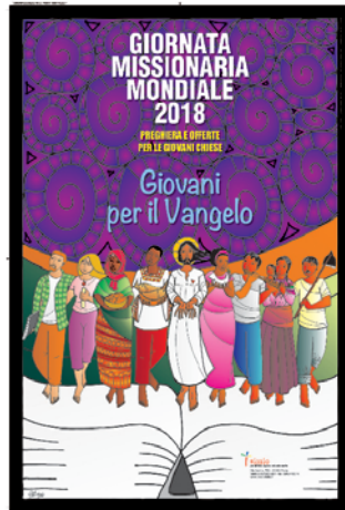
• Manifesto (cm 50x70)

GIORNATA MISSIONARIA MONDIALE 2018 (21 ottobre)