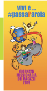
• Immaginetta •