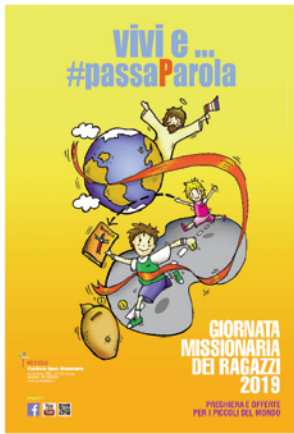
• Manifesto (cm 50x70)