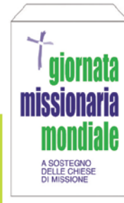
• Bustina per offerte